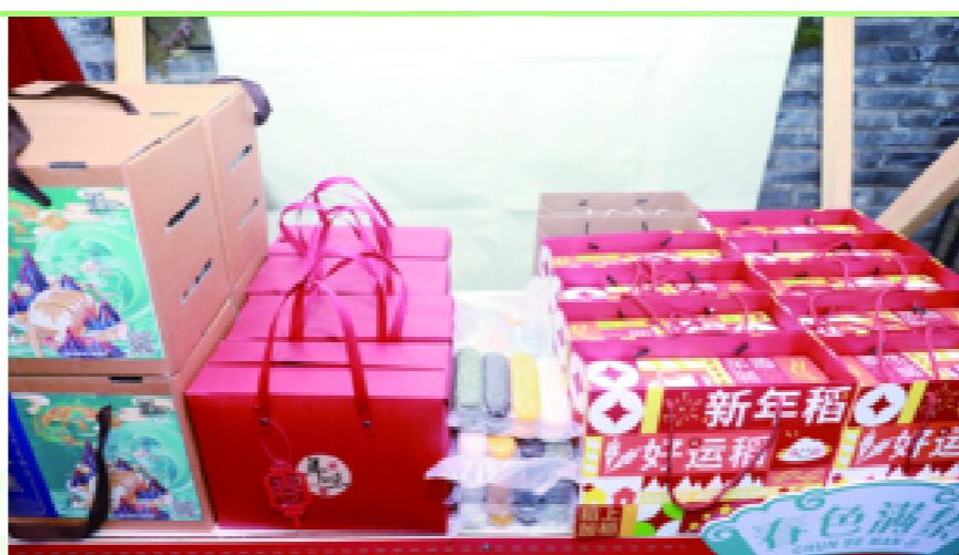
热闹的“非遗”文创市集上,集中展示着独具柯城特色的四季好物