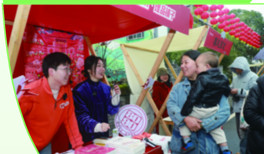
春礼市集人头攒动,游客们围在“理品铺子”前参加活动