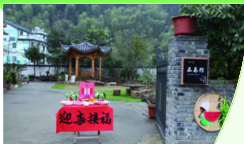
村民在自家门前摆放祭台祭品迎接春神

春光作序,万物和鸣。2月4日,癸卯年的第一个节气——“立春”在迷蒙诗意的细雨中,迎着八方瞩目姗姗而来,九华乡妙源村梧桐祖殿周围人流熙攘,热闹非凡。舞龙舞狮、二十四节令鼓、接春吟唱、鞭春牛……古老而隆重的迎春祈福仪式在此精彩上演,人们以质朴又充满文化底蕴的方式,表达对春神句芒的敬意,祈祷来年五谷丰登、国泰民安。 (文/图 赖小兰 许军 蒋怡 姜渝晨)