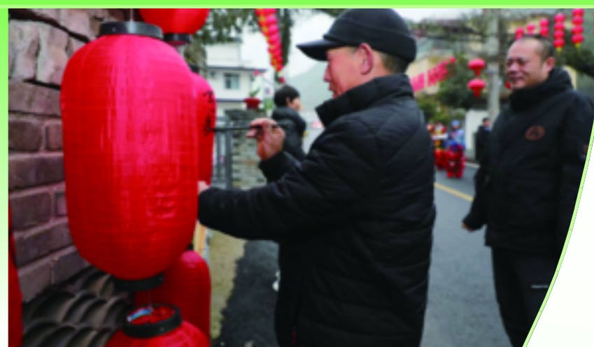
路两边挂着写满祝福的红灯笼,全村笼罩在祥和如意的氛围中