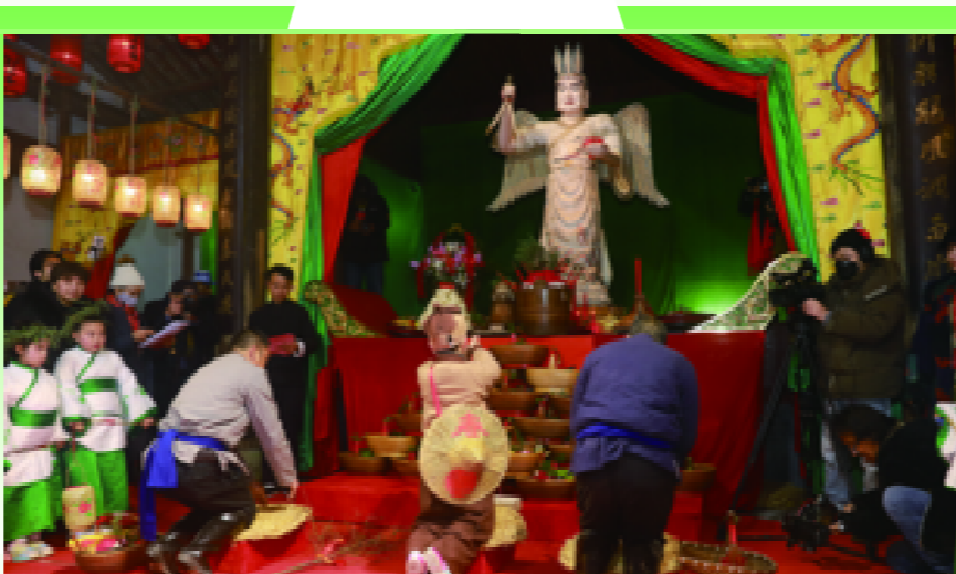
梧桐祖殿内,村民依次向春神句芒敬献花篮、供奉祭品,祈求风调雨顺、农耕丰饶