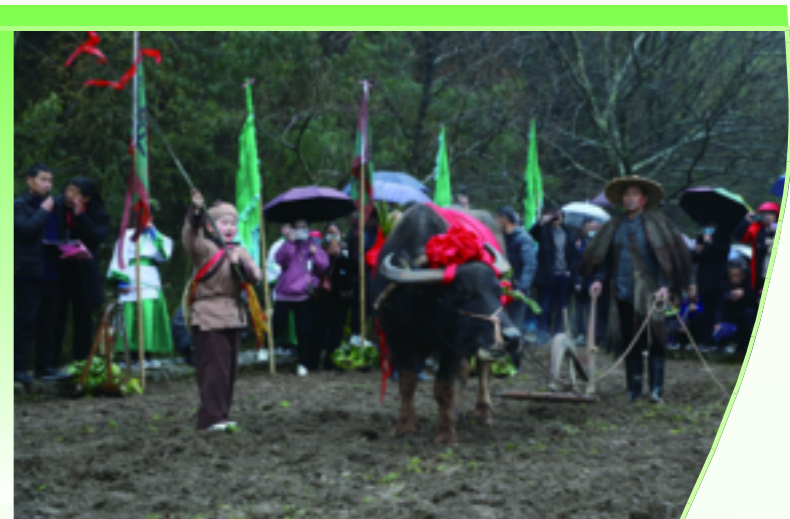
孩童扮成牧童句芒,一边手持彩鞭鞭打春牛,一边唱着《鞭春唱彩谣》