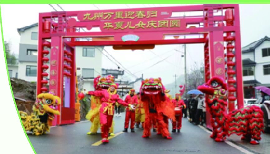
舞龙舞狮队在村口开展闹春表演